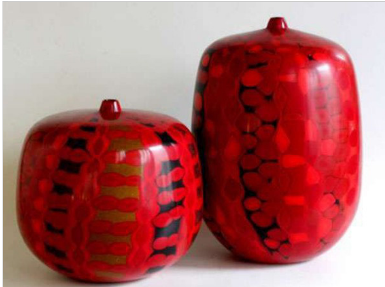
Arte del Vetro oggi in Italia, Villa Necchi Campiglio, Milano