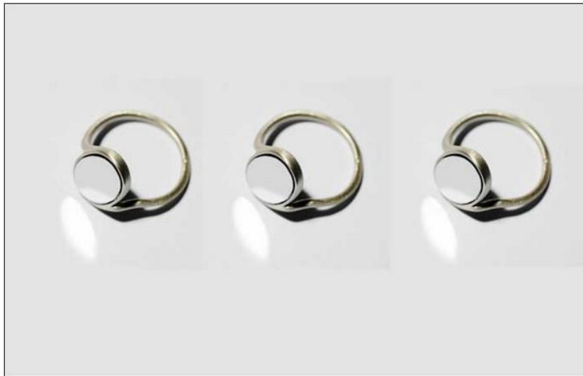
Collezione Blink, anello