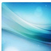
Museo Poldi Pezzoli FRANCESCA MO GIOIELLI