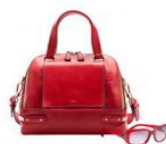
FURLA – SAN VALENTINO