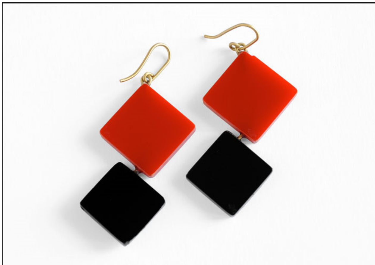
Collezione Pop, orecchini rossi e neri