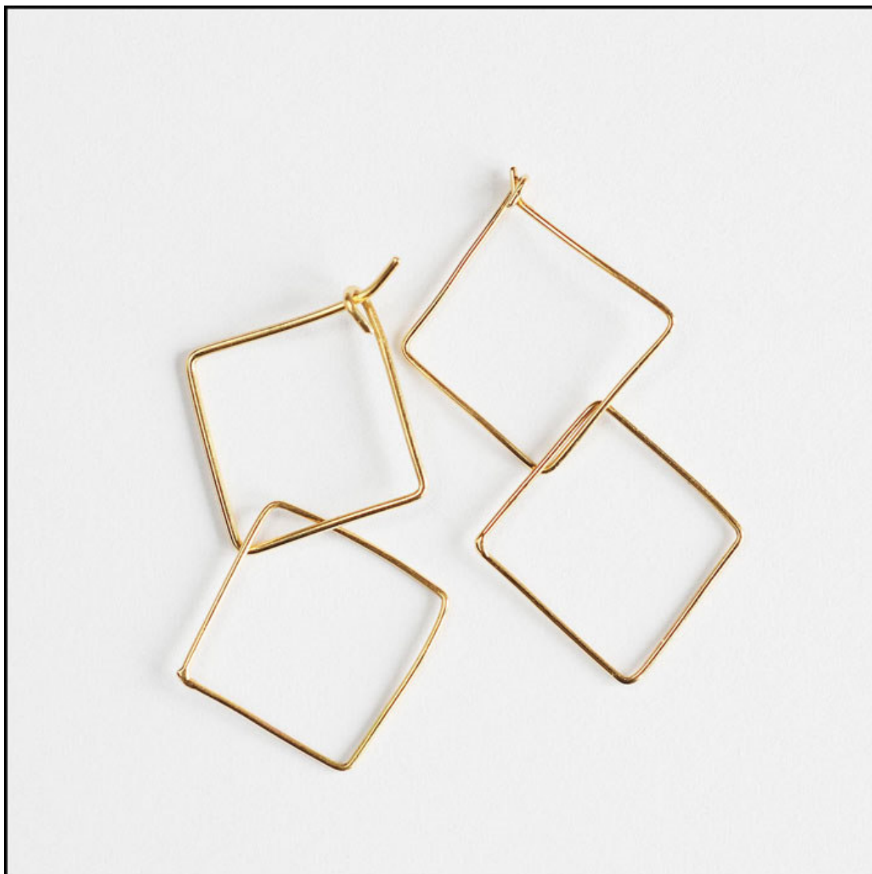
Orecchini Lilliput a due elementi