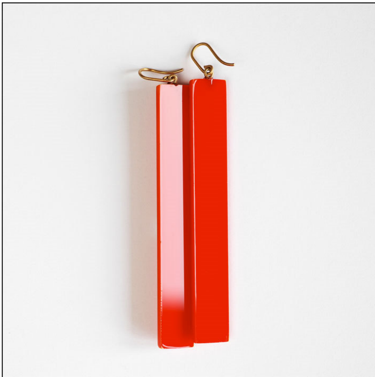
Collezione Pop, orecchini lunghi