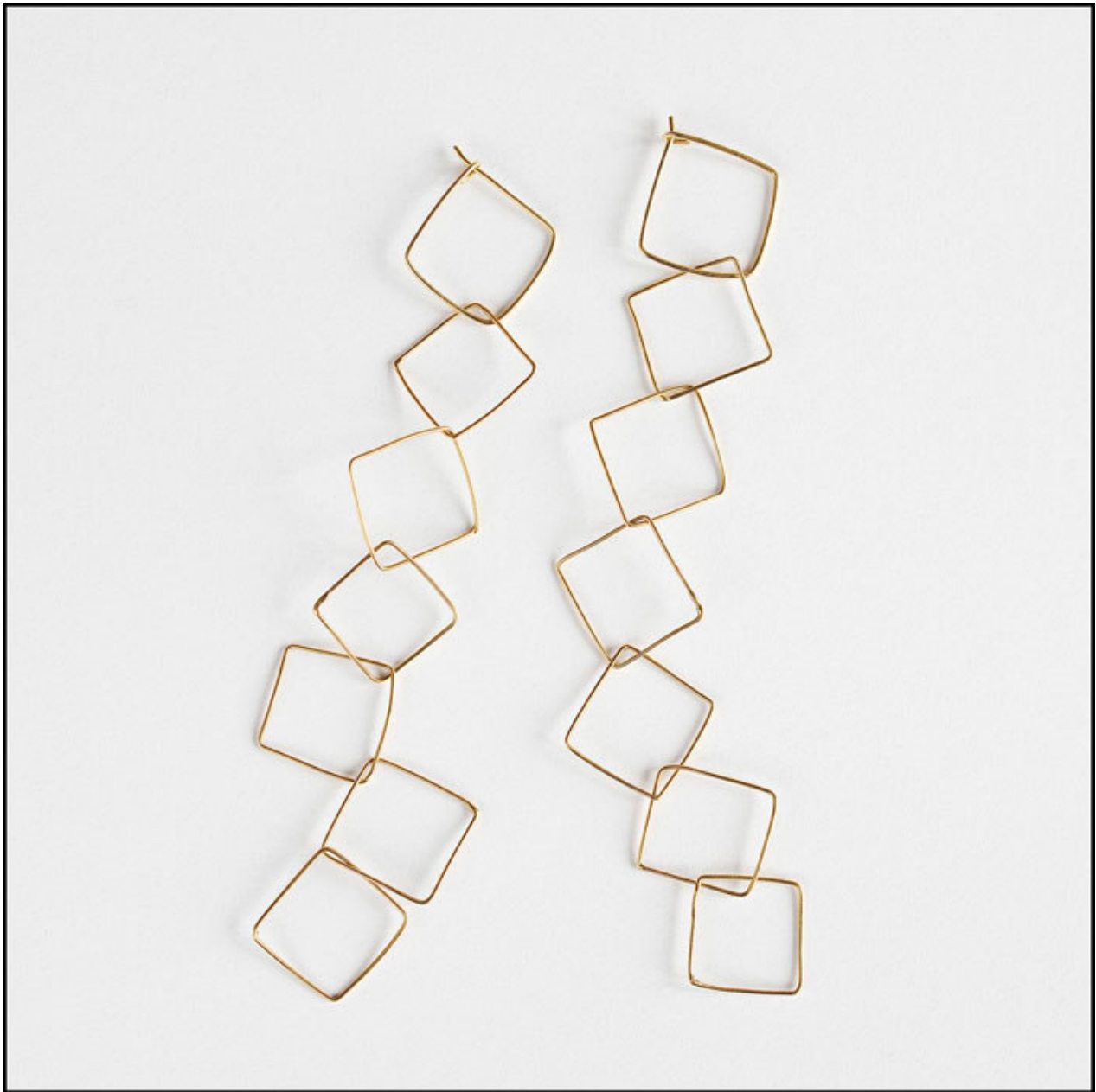
Collezione Lilliput, orecchini a otto elementi